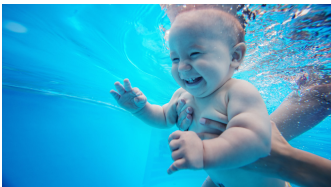
Mit Spaß durch die Beikostzeit

Tel.: 0231 922-1252 E-Mail: elternschule@klinikum-westfalen.de